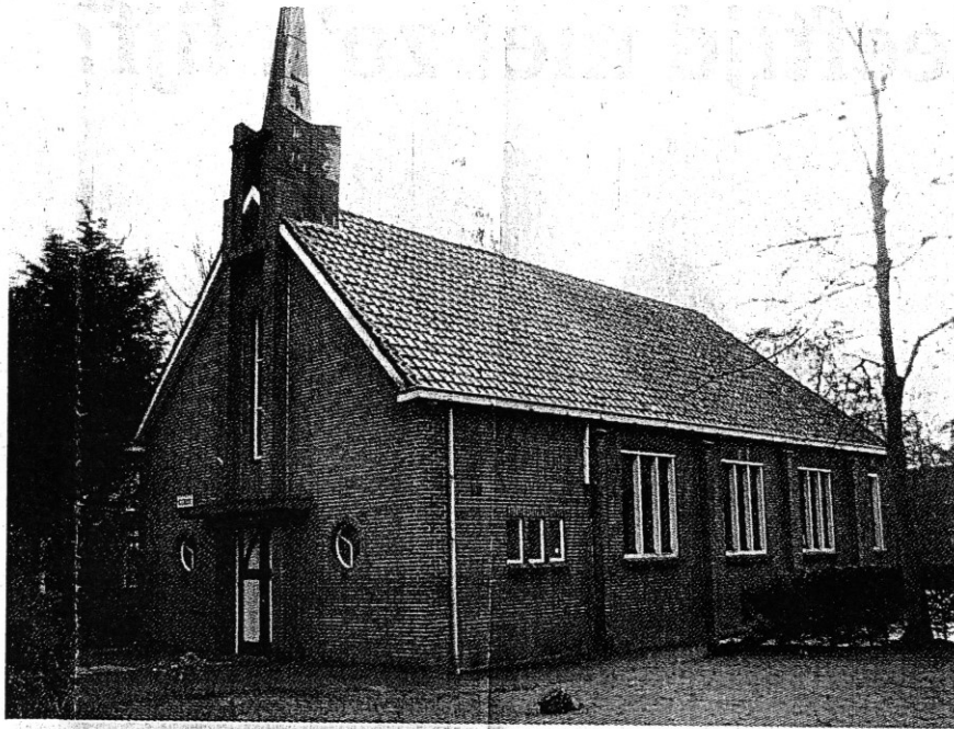
De gereformeerde kerk aan de Stationsweg 53 is een gemeentelijk monument.

Het was eeuwenlang een bijna onmenselijke taak voor de pachters om wat op de Waardse grond te verdienen, maar de pachten bleven hoog. Ruimte